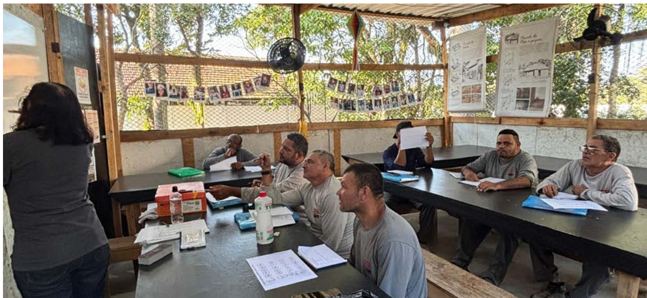
Aulas são voltadas para o uso social e crítico da linguagem em diferentes contextos da vida

As iniciativas socioculturais desenvolvidas nos canteiros priorizam a valorização dos saberes locais e das histórias individuais e coletivas de cada grupo participante. Ações como alfabetização, educação patrimonial e cidadania, melhorias habitacionais e programas de participação nos resultados transformam o Além dos Números em uma referência de boas práticas, voltadas à inclusão social, à valorização humana e ao fortalecimento dos vínculos entre equipes, empresas e comunidade.