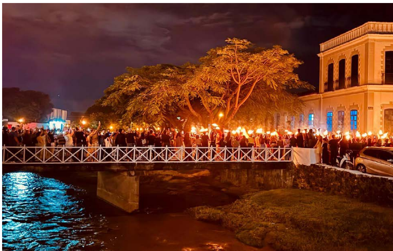
Foto de Thiago Fernando Sant'anna e Silva foi uma das oito premiadas

O Concurso FotoFogaréu deste ano premiou 8 fotografias entre 330 imagens inscritas e produzidas durante a tradicional Procissão do Fogaréu, na cidade de Goiás, uma das mais emblemáticas manifestações culturais e religiosas do país. A iniciativa foi realizada pelo Instituto Biapó, pelo Museu Casa de Cora Coralina e pela Organização Vilaboense de Artes e Tradições (Ovat), com o objetivo de valorizar o patrimônio imaterial vilaboense por meio da fotografia contemporânea.