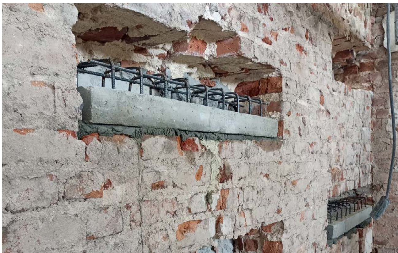
Procedimentos de engenharia aumentam a capacidade portante de edificações

Já as fissuras e rachaduras mais críticas receberam um tratamento específico de consolidação estrutural. Para isso, foram abertos nichos ao longo das lesões, distribuídos alternadamente nas duas faces das paredes e preenchidos com blocos de concreto armado. Após a recomposição das áreas afetadas, houve estabilização definitiva dessas estruturas.