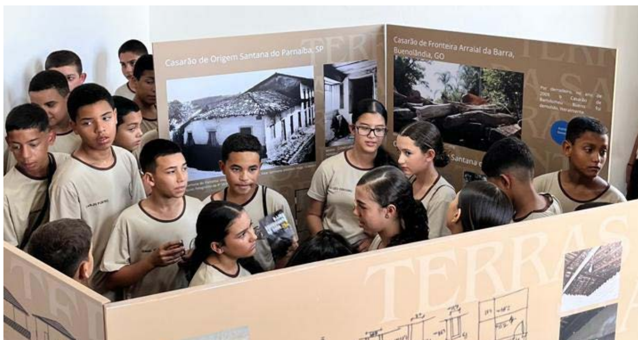
Parcerias com instituições de ensino ampliam as ações de desenvolvimento social e econômico na região

do Instituto Biapó, na cidade de Goiás, um espaço cultural vivo às margens do Rio Vermelho onde tradição e inovação se encontram.