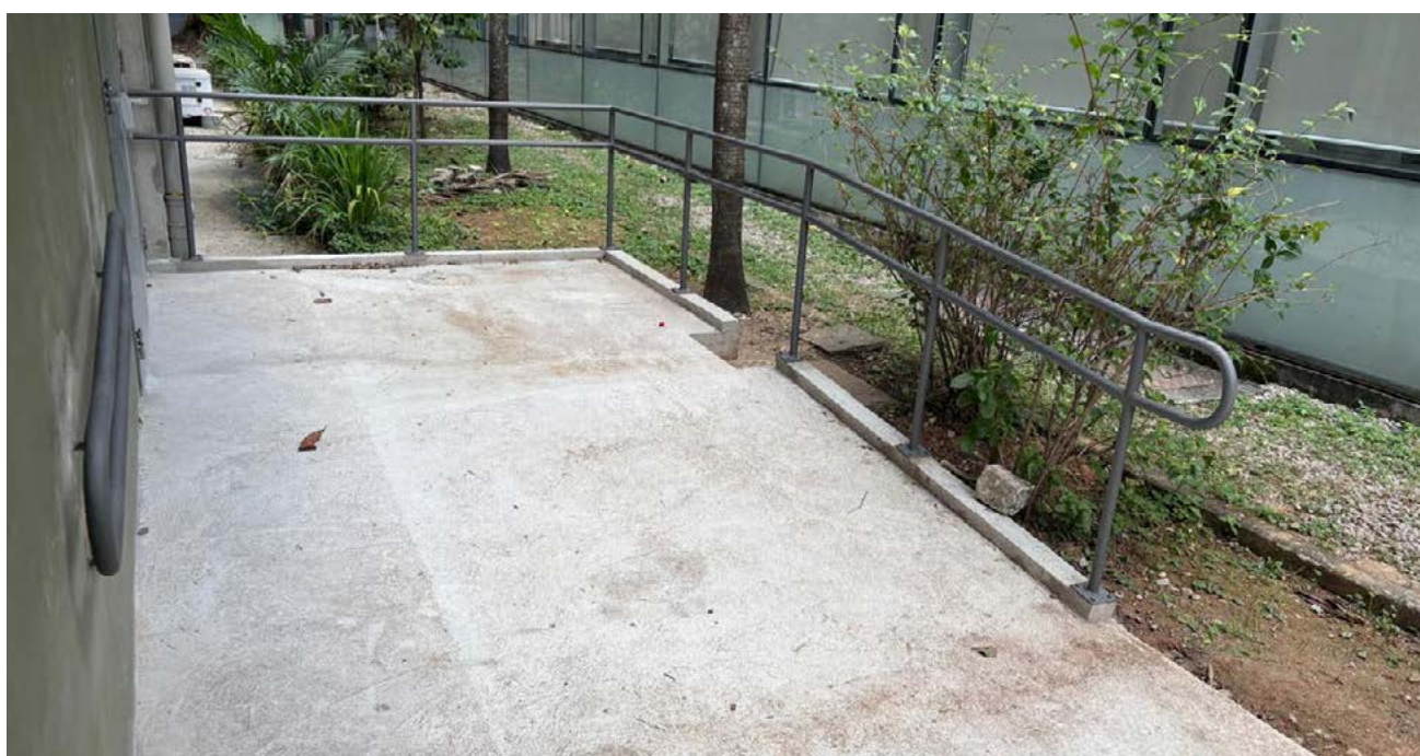
Estão concluídos serviços de execução da rampa de escape do auditório e instalação de corrimãos

Os trabalhos tiveram início em março deste ano e devem ser concluídos até junho de 2026. As intervenções executadas pela Construtora Biapó fazem parte do processo de recuperação e modernização dos espaços.